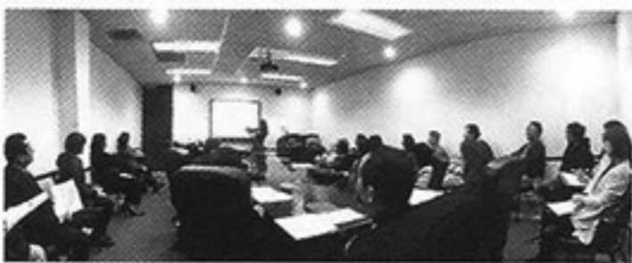
LA郊外トランスで行なわれたセミナーには、現地に住む約30人が受講。日本の葬儀費用、相続税率などの質問があったという

アメリカ・ロサンゼルスには多くの日本人が居住し、日本と同様、「終活」は大きな関心事の1つとなっている。高齢になるとそのまま同地で居住するか、帰国するかを考えるようになるという。また、どちらを選択するにしても、墓について悩む人も少なくない。こう